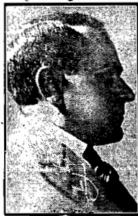
O sr. Getulio Vargas, presidente da Republica

PORTO ALEGRE, 28 (via aérea) — O Correo do Povo publica o seguinte: