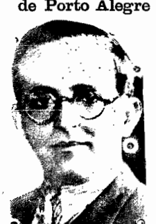
O governador Juraci Magalhães

RIO, 27 (via aérea) — Regressou ontem, do Rio Grande do Sul, por via aérea, o sr. Juraci Magalhães, governador da Baía, que foi áquela Estado assistir ás comemorações do Centenario Farrroupilha, efetuadas em Porto Alegre.