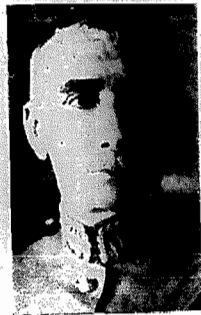
General João Gomes

RIO, 27 (via aérea) — Tonho deliberado assumir, hoje, o governo do Estado do almirante Protogenos Guimaraes.