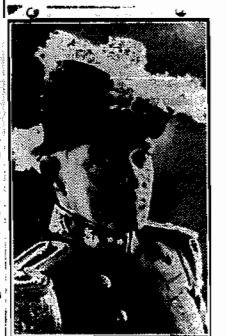
O Almirante Protopogenes Guimarães, candidato ao Governo do Estado do Rio

colaboração de todos aqueles que quiseram trabalhar lealmente pela terra fluminense, farei no Estado do Rio uma administração superior, porque ela será isenta de paixões políticas e de paixões regionais. Dentro da esfera da minha atribuição, obedecerei aos designios e às vontades de meus amigos coligados. Farei com eles política e administração, contando para isso com o esforço e a boa vontade de todos os fluminenses.