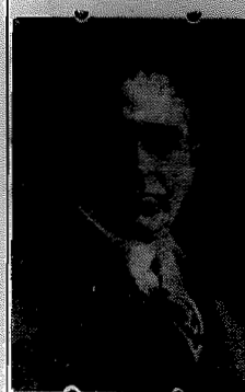
Presidente Getulio Vargas

Conforme estava anunciado, passou ontem por esta capital, ás 14,30 horas, a bordo do hidroavião «Caicara», o sr. dr. Getulio Vargas, Presidente da Republica, que vai a Porto Alegre assistir á inauguração dos festejos comemorativos do Centenario Farrroupilha.