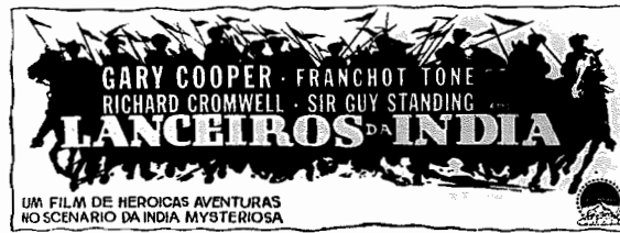
UM FILM DE HEROICAS AVENTURAS NO SCENARIO DA INDIA MYSTERIOSA

Continua a sua triunfal carreira O maior sucesso do ano