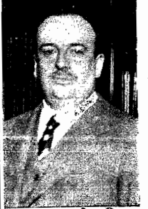
O sr. Souza Costa, Ministro da Fazenda

RIO, 13 (via aérea) — Em reunião anunciada para esta tarde, a Comissão de Reforma