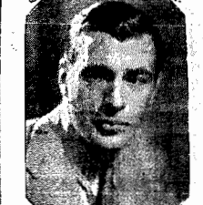
Gary Cooper o heroi de «Lanceiros da India»

Quem quizer conhecer a historia dos famosos lanceiros de Bengala não deve perder esse filme, que é uma reconstituição perfeita da vida das lutas que os hindus sustentam contra a Inglaterra, pela sua liberdade, há tantos annos casada.