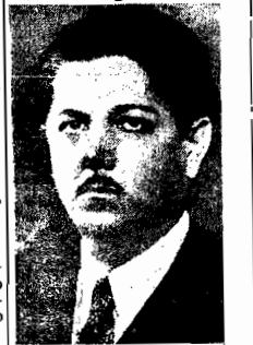
O sr. Benedito Valadares

RIO, 14 (via aérea)—O governador Benedito Valadares