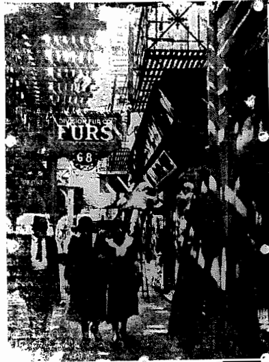
Nova York — Uma rua comercial num elevadado.

NOVA YORK, 13 (via rádio) — A gréve dos radiotelegrafistas, declarada hoje pela manhã, impediu a partida de dez navios e um cargueiro americano, entre os quais se conta o Pelen , que se destina a Cuba e a América Central e o Yucatan que se destina a Cuba e ao México.