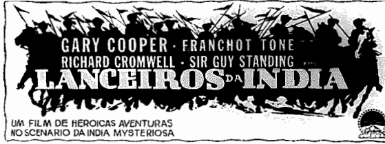
UM FILM DE HEROICAS AVENTURAS NO SCENARIO DA INDIA MYSTERIOSA

A cidade inteira o comentará! Sonha-se com 'Lanceiros da India'! O entusiasmo dos que se referem a esse filme não tem limite