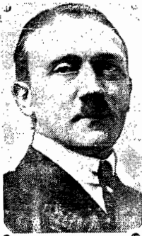
O chanceler Adolf Hitler

«SUFOCAREMOS TODA OPOSIÇÃO, DE QUALQUER PARTE QUE VENHA», DIZ O CHANCELER HITLER, EM SUA PROCLAMAÇÃO — A ALEMANHA PERCEBEU O VALOR DA LIBERDADE QUANDO A PERDEU