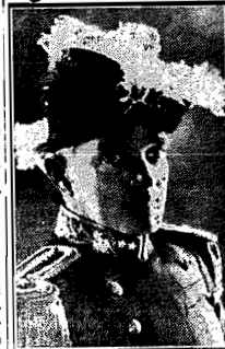
O almirante Protógenes Guimarães ministro da Marinha

RIO, 13 (via aérea) — Afim de proseguir nas manobras navais iniciadas no mês findo, seguiram, ontem, para a Ilha Grande, ás primeiras ho-