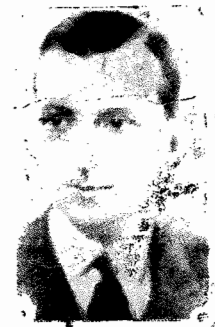
Ministro Vicente Ráo