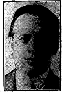
General Flores da Cunha

PORTO ALEGRE, 3 (via aérea) — O general Flores da Cunha, com a presença das mais altas autoridades, reassumiu ontem o exercicio do cargo