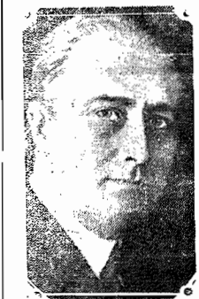
O presidente Roosevelt

ROOSEVELT SANCCIONOU A LEI DE SEGURANÇA SOCIAL.