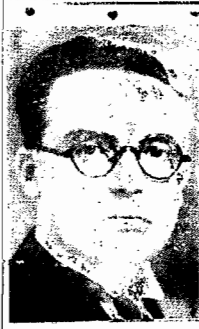
O ministro Odilon Braga

RIO, 11 (via aérea) — O sr. Odilon Braga foi convidado a visitar o Uruguai, por ocasião