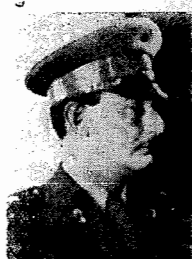
Capitão Felinto Müller

RIO, 10 (via aérea) — Podemos assegurar que é completamente destituído de fun-