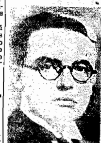
Ministro Odilon Braga

Éra esperada a prisão de um sub-official da mesma seccão. Pecuniaria de Prado, em Montevideo. Com a omissão do ministro