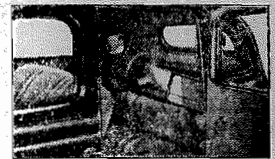
As malas viajam cuidadosamente protegidas da pista e do tempo neste novo compartimento.

ACCOMODE seis pessoas neste novo Ford e, mesmo assim, não ficará superlotado. E' um carro grande e confortável, com largo espaço para as pernas nos seus dois compartimentos. Viaja-se no banco traseiro com o mesmo conforto que antes só o assento dianteiro proporcionava. Permite-o um melhoramento exclusivo do Ford: a suspensão dos assentos entre as molas — bem como as almofadas e molas mais macias.