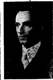
monagens de apreço e estima que lhe são prestadas, o fá qual nos associamos com verdadeiro jubilo.