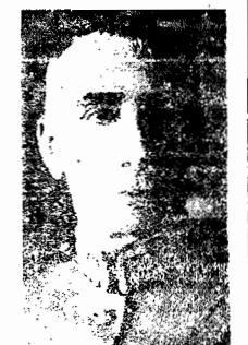
General João Gomes, ministro da Guerra

RIO, 31 (via aérea) — O general João Gomes determinou que as requisições de transportes dentro e fóra do país devam se fazer pelo Lloyd ou pelas empresas subvencionadas