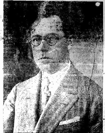
O dr. Nerêu Ramos, Governador do Estado

seus primeiros meses de administração, mostrava o empenho de traduzir para a realidade o programa que pregára. Programa que se está con-