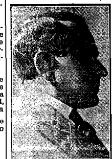
O sr. Getúlio Vargas, presidente da República