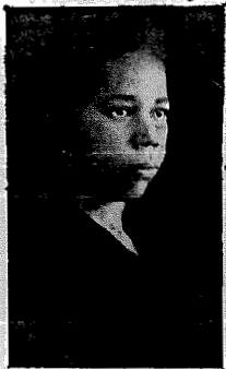
Deputada Antônia de Barros

Segundo estamos informados a data de hoje será conmemorativamente comemorada na Assembleia Constituinte.