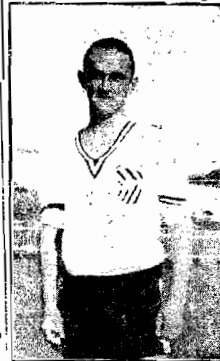
Calico, o veloz e perigoso atacante avai-negro

Por esse motivo o sr. Diretor desportivo do simpático azul e branco pode por nosso intermédio o emparelhamento, de todos os seus jogadores no treino de hoje à tarde no campo da F. C. C.