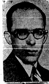
O ministro Gustavo Capanema

lho Nacional de Educação e o Plano Nacional de Educação. Achava que a elaboração do plano devia ser precedida de um amplo inquerito nacional. Os elementos colhidos em todos os Estados seriam sistematizados pelo seu Ministerio, que ofereceria assim ao Conselho um anteprojecto destinado a facilitar a complexa tarefa. Esse Conselho funcionaria como um poder constituinte educacional. O Legislativo examinará o plano, que, finalmente, seria sancionado pelo governo.