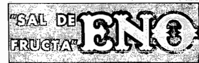
Eno é vendido em tres tamanhos: Pequeno, Grande, Gigante. As palavras "Sal de Fructa" e "ENO" são marcas registradas.

Purifique o seu sangue, desintoxique o seu organismo, regule as suas funcções digestivas com o copo matinal de "Sal de Fructa" Eno, bom ha 65 annos, invariavelmente bom. Eno não forma habito. Mas habitue-se ao Eno.