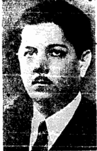
O governador Benedito Valadares

BELO HORIZONTE, 4 (via aérea) — Está confirmada a ida do governador Benedito Valadares, segunda-feira pro-