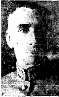
O general João Gomes, ministro da Guerra

2) — Quanto à seleção para a proposta de promoção dos sub-tenentes do Exército em diante, devem concorrer todos os sargentos com o curso de comandante de pelotão com que satisfizeram as demais condições, assegurando-se a preferência aos cursos feitos na Escola de Armas.