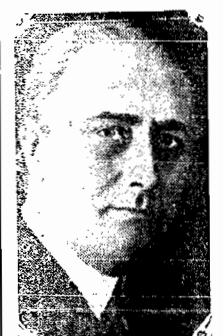
O presidente Franklin Roosevelt