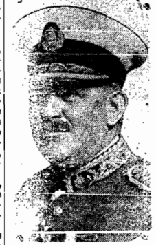
General Justo, presidente da Argentina

Na hipótese da lei agora apre- sentada conseguir aprovação do Senado, as mulheres argen- tinas serão obrigadas a exer- cer o direito do voto, visto que ficarão no mesmo pó do igualdade dos homens, isentas, porém, do serviço militar. Recordamos que em 1933 foi apresentado ao Senado um projeto de lei idêntico ao do sr. Palacios, que já havia ob- tido aprovação da Câmara, mas que ficou retido na alta câmara até o encerramento dos trabalhos dessa Casa do Parlamento, nunca mais se fa- lando no referido projeto.