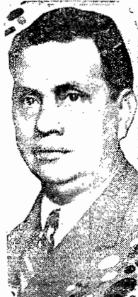
General Góes Monteiro

RIO, 4 (via aérea) — Reu- niu-se, ontem, no Ministerio da Guerra, o Conselho de Justificação, requerido pelo coronel Alvaro Alencastro, a-