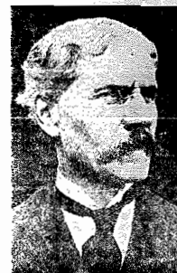
O sr. Ramsay Mac Donald, mi- nistro inglês

ROMA, 4 (via aérea) — In- formam noticias oficiais que o presidente do Conselho de Ministros, sr. Benito Mussolini, convocou para uma sessão ex- traordinaria o Conselho dos Almirantes que é o órgão su- premo consultivo nas questões que interessam á marinha de guerra. O ato foi presidido pelo sr. Mussolini. Segundo consta, os almirantes examina- ram a situação decorrente da conclusão do tratado naval anglo-alemão, assim como o problema do transporte de tropas, material belico e vi- veres para a Africa Oriental, visando notar as remessas que até agora foram muito lentas.