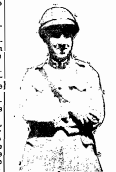
O' General Cristovam Barcelos, candidato ao governo do E. do Rio

RIO, 4 (via aérea) — O Tribunal Regional do Estado do Rio enviará hoje a pape-