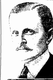
O chanceler Saavedra Lamas

BUENOS AIRES, 4 (via aérea)—Ao apitar, na sessão inaugural da Conferencia da Paz, a designação do sr. Saavedra Lamas para a presidencia da Assembléa, o ex-baixador do Brasil, sr. José Bontade de Andrade e Silva, pronunciou uma allocução em que acentuou textualmente: «Quero logo livremente exprimi-