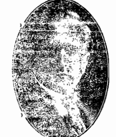
O sr. Getúlio Vargas

RIO, 3 (via aérea)—O sr. Getúlio Vargas, por intermédio do ministro da Fazenda, encadeou isenção de direitos e taxas aduaneiras ao mate-