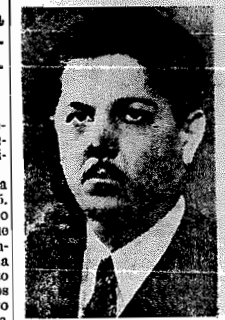
O governador de Minas, sr. Benedito Valadarez

BELO HORIZONTE, 3 (via aérea)—Em audiência previamente marcada, o sr. Benedito