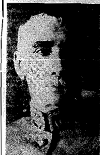
General João Gomes, Ministro da Guerra

a idade para matricula dos capitães combatentes do Exército na Escola do Estado Maior, cujo limite maximo era de trinta e seis annos.