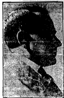
Sr. Getulio Vargas

RIO, 2 (via aerea) - Foi inaugurado oficialmente o sindicato dos funcionarios do Instituto de Aposentadorias e Pensões dos Maritimos, na sessão comemorativa do segundo aniversario da fundação desse Instituto. Ao ato compareceram o presidente da Republica e diversas personalidades de destaque na politica brasileira, imprensa e meios militares, os