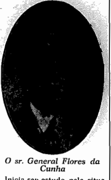
O sr. General Flores da Cunha