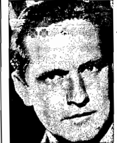
Uma Sombra que Passa será exibido unicamente no domingo, pelo Imperial e Roy al.

O programa que os Coroados organizaram para domingo, e de que será elemento principal o suntuoso filme da Paramount, Uma Sombra que Passa , atende ao clamor constante dos fans, por que se lhes den coisas novas no écran. Efectivamente tudo no filme é novo, a começar dos ambientes e pelo argumento, e a terminar nos interpretes, entre os quais são principais os que formam uma dupla romantica, de um de cujos elementos jámalis poderia nunguem cogitar como personagem idílico. Protagonistas Frederic March um dos grandes actores da actualidade, e o mais apontado como legitimo herdeiro de tronco que John Barrymore tantos anos occupou, e ao lado dele uma atriz que veiu do Broadway glorificada, e a quem a Paramount, com bem fundadas razões, apresenta como estrela — Evelyn Venable, tipo ideal de mocidade e de pureza.