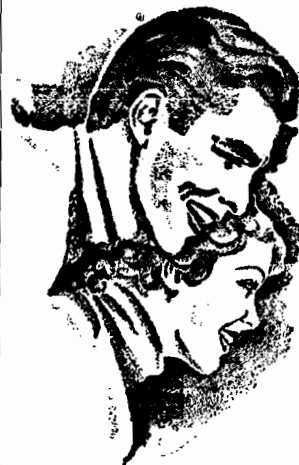
Frederic March e Evelyn Venable em «Uma Sombra que Passa».

Frederic March reaparecerá domingo nos Cines «Corcos».