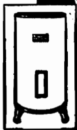
DOIS TIPOS A ESCOLHA: 1. Para 30 litros, 1 str. de altura, 40 cm. de diametro. 2. Para 100 litros, 1,16 m. de altura, 50 cm. de diametro.

PARA todas as suas applicações hygienicas, e banho, a barba, e tratamento da pelle, para todas as applicações domesticas, na cozinha, na copa, na lavanderia, e aquecedor de agua General Electric oferece-lhe um serviço pratico, economico e simples.