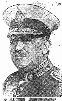
BUENOS AIRES, 14 — No discurso pronunciado por ocasião do banquete em honra do cardeal Pacelli, o presidente Justo assinalou que era a primeira vez que a Argentina e a America espanhola tinham a honra de receber um legado pontificio e em seguida acentuou:

«O catolicismo é a fraternidade cristã que tende a abarcar a humanidade inteira. O mundo necessita estreitar os laços espirituais, afim de estabelecer a fraternidade entre os homens atormentados pelos graves problemas da hora». Acrescentou que os povos americanos, de espirito e caracter cristão, guardavam intacta a herança de paz e amor, recebida da Espanha. O presidente Justo encerrou sua oração agradecendo a Pio XI a insigne distincção que representava a designação do secretario de Estado da Santa Sé, cardeal Pacelli, para as funções de legado pontificio ao Congresso Eucaristico Internacional de Buenos Aires.