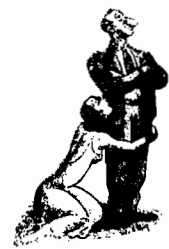
Jimmy Durante o maior nariz do mundo

Palooka o super espectáculo do riso «Palooka» vai dar-nos hora e meia, no domingo, de gargalhadas salutas para a alma e para o corpo. «Palooka» mostra-nos a edição revista e melhorada de um Don Juan contemporaneo, de um Casanova actualizado, de um Monsieur Beaucaire sem roupa xtra vagantes, de um Benvenuto Cellini ainda mais irresistivel Jimmy Durante! Ele sabe ser «manager» de corações femininos e de panhos de «boxeours» invencíveis.