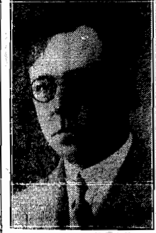
Encabeça a mesma chapa o nome do Sr. Neréu Ramos, atual leader da maioria da sua bancada. O Sr. Neréu Ramos é uma das figuras respeitáveis da

RIO, 14 (via aérea) — O Jornal do Brasil , em sua edição de ontem, publicou o seguinte: «O Partido Liberal de Santa Catarina escolheu ontem a chapa de deputados federais, que sustentará nas urnas de 14 de Outubro.