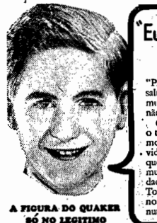
A FIGURA DO QUAKER SÓ NO LEGITIMO

Em sessão ordinaria reunem-se hoje ás horas do costume, os membros do Superior Tribunal de Justiça.