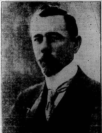
Dr. Lauro S. Müller