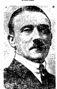
O CHANCELER ADOLF HITLER

Berlim, 7.— (via aerea) — As organizações dos estudantes, na presença do chanceler Adolf Hitler, receberam novos estatutos, segundo os quais todos os seus membros são obrigados a aderir às tropas de assalto, ao serviço do trabalho voluntário e a receberem instrução política, afim de se tornarem alemães conscientes de sua honra e prontos a defendê-la."