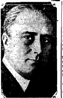
O PRESIDENTE FRANKLIN ROOSEVELT

WASHINGTON, 7 (via aerea) — Sobre-se que o presidente Franklin Roosevelt teria manifestado o desejo de trabalhar para obter a redução dos juros excessivos que pesam sobre as dívidas de todas as classes, inclusive as industriais, particulares e estrangeiras. Os observadores, comentando o plano de chefe da nação, dizem que o mesmo deverá ser principalmente aplicado às dívidas latino-americanas, cujo juro de oito por cento é considerado pelo presidente da Republica, particularmente elevado em face da situação atual.