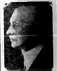
O DR. ANTONIO CARLOS, PRESIDENTE DA ASSEMBLÉA NACIONAL CONSTITUINTE

O interventor sul-riograndense está mal impressionado com a lentidão dos trabalhos da Constituinte. Em palestra, ontem, ele frizava que a Assem-