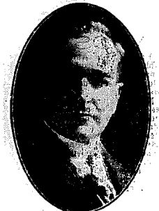
O sr. Getúlio Vargas, chefe do Governo Provisório

mente perturbado o país devem ser levadas em conta desta feita, pois tudo gravita em