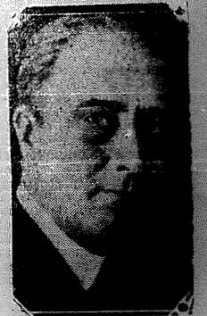
O sr. Franklin Roosevelt, atual presidente dos Estados Unidos e criador da N. R. A.

DETROIT, 14 (via aerea) —O sr. Henry Ford, rompendo pela primeira vez o silêncio que vinha mantendo desde as últimas declarações do general Hugh Johnson, anunciou que resolveva concordar com a «N.R.A.», sob certas reservas, e que continuaria a apoiar o presidente Roosevelt. Tivera, aliás, ensejo de precisar já sua atitude em Washington. Duvidava, porém, que o plano governamental tivesse podido aumentar consideravelmente o poder aquisitivo das massas.