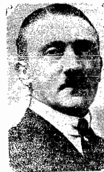
O chanceler Adolf Hitler, chefe dos Nazis alemães

Budapest, 14 (via aerea) —As autoridades húngaras deram severas providências para que seja reforçado o serviço de vigilância na fronteira, afim de evitar que os agitadores nazis austriacos continuem a se retirar neste país.