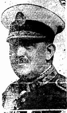
Agostin P. Justo, presidente da República Argentina

O chanceler argentino conferenciou, hoje, com os delegados das duas partes. O presidente Justo receberá, por sua vez, ao que corre, o presidente da Comissão da Sociedade das Nações, sr. Alvarez de Vayo, e os delegados bolivianos.