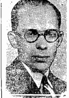
O sr. Gustavo Capanema

RIO, 17 (via aerea) — Em resumo, a situação mineira é a seguinte: As demoras continuam, nada se tem do essencial, pelo menos até esta manhã, o que não quer dizer que de uma hora para outra a solução venha, finalmente. As hipóteses permanecem. A primeira é a interventoria para o sr. Virgilio de Melo Franco e o Ministerio da Educação para o sr. Gustavo Capanema; a segunda é a interventoria para o sr. Afranio de Melo Franco e o Ministerio do Exterior para o sr. José Carlos de Masceno Soares, o que quer dizer, a S. Paulo, e a terceira, é pela elevação do sr. Gustavo Capanema na interventoria, como solução do não proído, aliás, a que vem apresentando mais aceitavel pelas correntes politicas das Alagoas, sem excepção, mesmo, talvez, do porreiro. Ainda ontem, estiveram tratando do caso mineiro, sob o ponto de vista revolucionario, os srs. Góes Monteiro, Jurez Tavora, Cristiano Machado, Augusto de Lima e outros, indo mais tarde o general Góes conversar com o ministro da Educação. Este, segundo dizem, não se mostrou muito demonstrando de uma dedicação summa, declarando-se perfeitamente disposto a abrir mãos da interventoria, desde que se apresentasse uma combinação, para que a paz politica reinasse em seu Estado. A margem das hipóteses que acima aludimos e que têm a ordem de prioridade, igualmente, a estudar-se a possibilidade de se estabelecer um tratado para a interventoria.