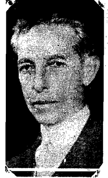
O sr. Afonso de Melo Franco, ministro das Relações Exteriores do Brasil