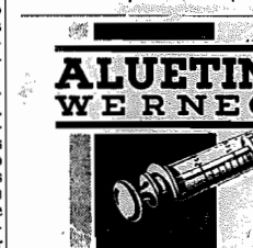
A ALUETINA WERNECK, possui alto poder microbicida e a sua acción contra a syphilis em todas as suas manifestações e de grande valor na therapeutica moderna.

de distilarias nos principais centros de produção, afim de se fornecer com abundancia o alcool-motor e solicitar recursos do Tesouro. O sr. Getulio Vargas encerrando a entrevista, referiu a sua admiração pelos homens do nordeste, cujo heroismo, e fira ntando de a natureza, suportando a seca, abandonados, desajudados dos governos, realiza o milagre de viver arrancando do seio da terra calcinada elementos de resistencia, perpetuando as qualidades de energia, intelligencia e força da nossa raça.