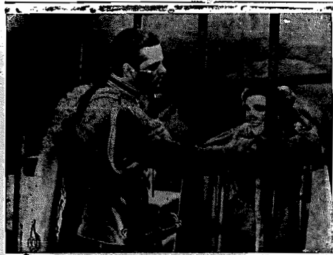
MUSICAS de Oscar Hammerstein - Georges Gerswin Herbert Storchart - Otto Harbach