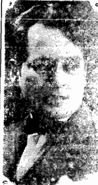
Figuredo Fimntel, o autor do Romance