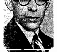
O sr. Gustavo Capanema, chefe do novo governo mineiro