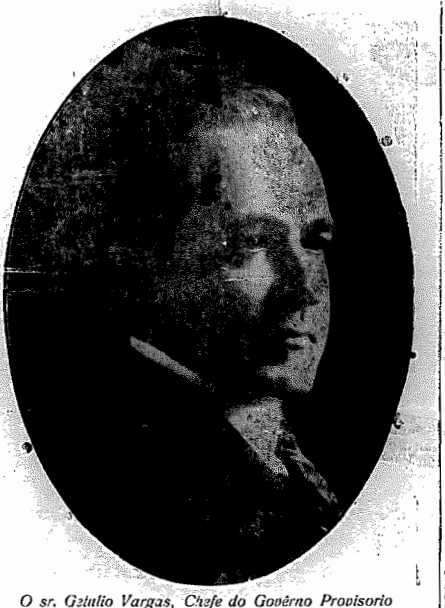
O sr. Getúlio Vargas, Chefe do Governo Provisorio