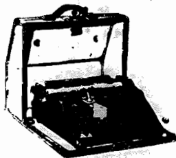
MACHINAS DE ESCREVER, PORTATEIS E PARA ESCRITÓRIOS