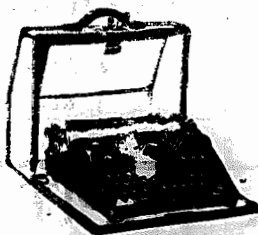
MACHINAS DE ESCRIVER, PORTATILS E PARA ESCRITORIOS