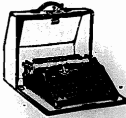
MACHINAS DE ESCREVER, PORTATEIS E PARA ESCRITORIOS