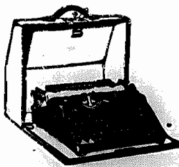
MACHINAS DE ESCREVER, PORTATEIS E PARA ESCRITÓRIOS