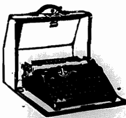
MACHINAS DE ESCREVER, PONTATEIS E PARA ESCRITORIOS