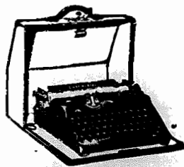
MACHINAS DE ESCREVER, PORTATEIS E PARA ESCRITORIOS