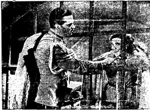
Com: Bernice Claire, Noah Beery, Alice Gentle, Alexandre Gray

Completamente colorida pelo processo tencolor