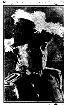
O almirante Protogenes Guimarães, ministro da Marinha

O ALMIRANTE PROTOGENES VIAJARA NA PROXIMA TERÇA-FEIRA RIO, 27 (R.) — O almirante Protogenes Guimarães, Ministro da Marinha, mandou reservar dois lugares no avião da Condor que seguirá na proxima terça-feira para o sul.